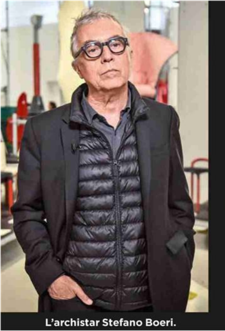
L'archistar Stefano Boeri.