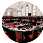
COMUNE DI MILANO

Il 15 marzo 2024 il giornalista ha pubblicato sul proprio profilo Facebook e sul social X un post contenente dichiarazioni gravemente lesive dell'immagine del Comune di Milano alludendo a condotte corruttive poste in essere da dipendenti comunali