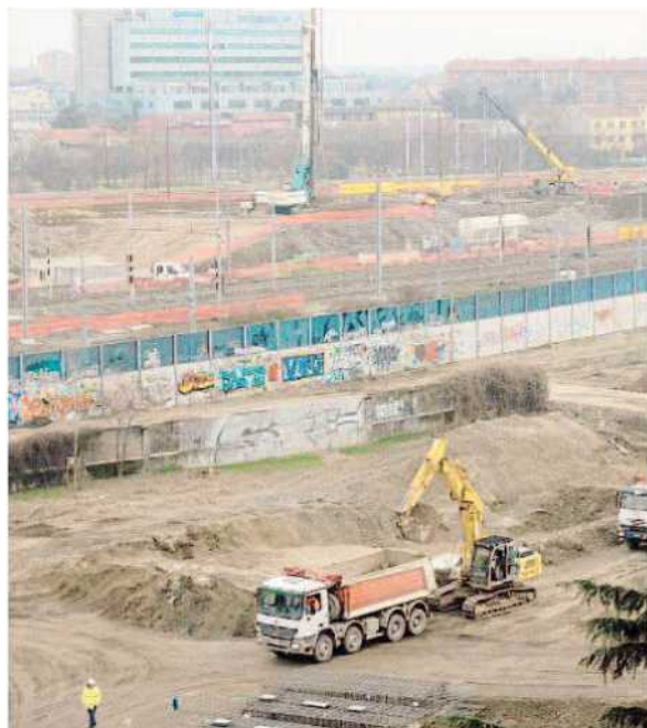
Il cantiere della M4 multato da Palazzo Marino