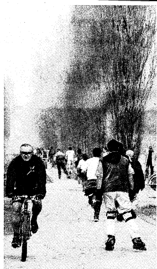
Crescono i movimenti di tutela dei parchi