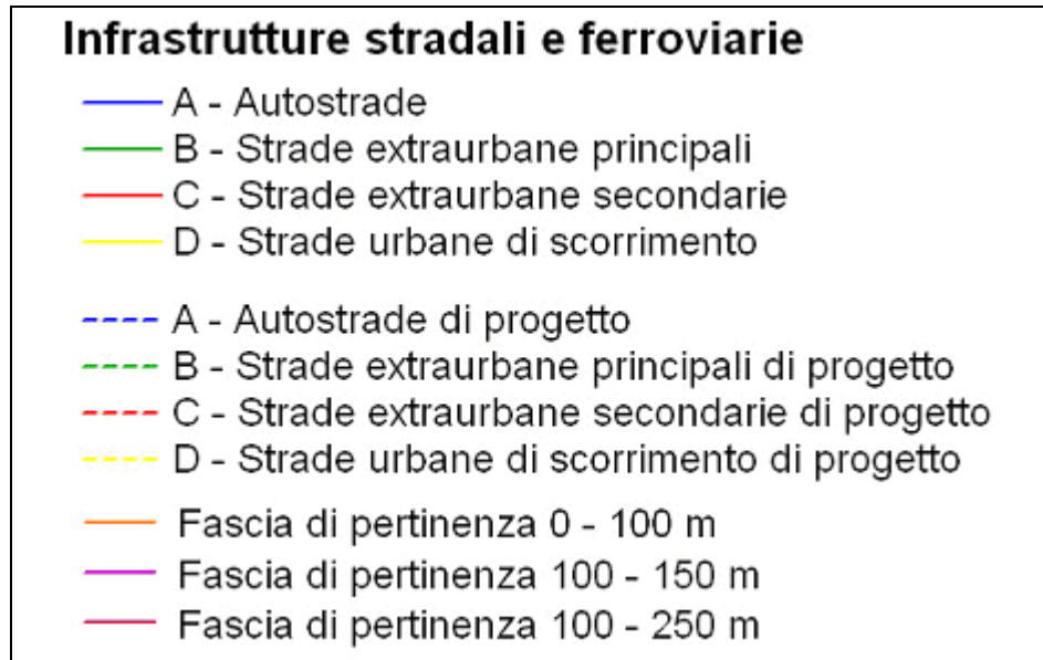
Figura 1 - Legenda delle infrastrutture di trasporto