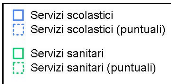
Figura 4 - Legenda dei recettori sensibili

Nella Figura 4 è riportata la legenda dei recettori sensibili.